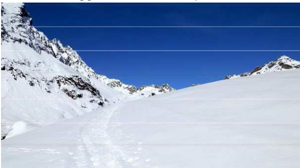
Discesa dallo stesso percorso

Come la maggioranza delle capanne svizzere, anche la Campo Tencia è sempre aperta, dunque c'è possibilità di ripararsi e scaldarsi al fuoco della stufa.